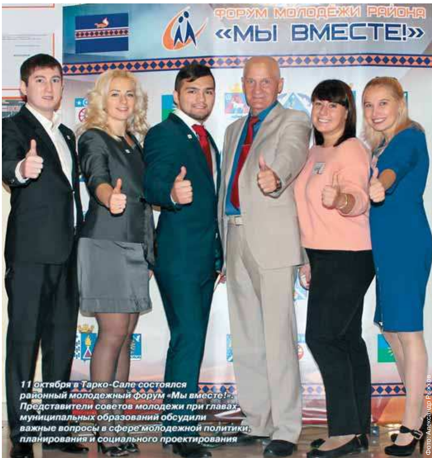
11 октября в Тарко-Сале состоялся районный молодежный форум «Мы вместе!». Представители советов молодежи при главах муниципальных образований обсудили важные вопросы в сфере молодежной политики, планирования и социального проектирования

В Пуровском районе проходит конкурс среди семей работников культуры «Творчество нас связало!»