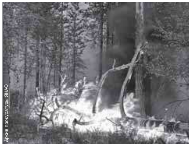
Архив прокуратуры ЯНАО

По материалам, предоставленным природоохранной прокуратурой ЯНАО