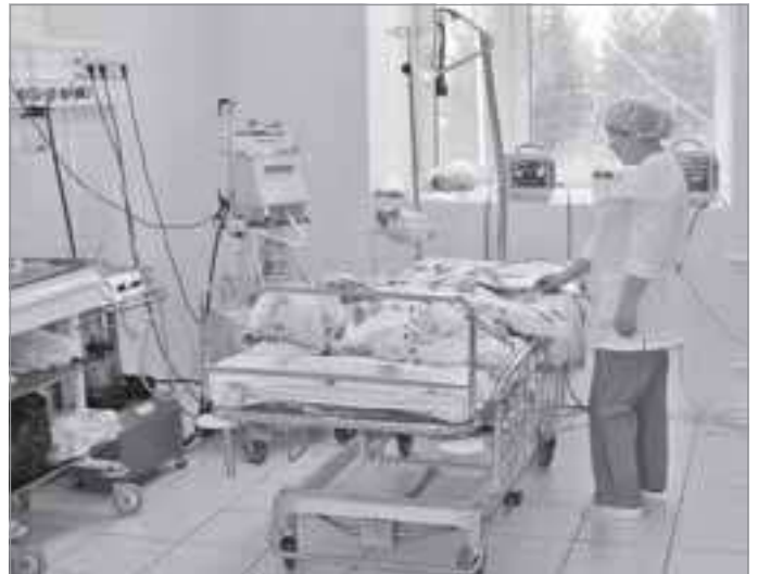
Детская реанимационная палата