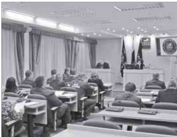
Заседание комиссии ГО и ЧС

Незамедлительно прошло заседание санитарно-эпидемиологической комиссии администрации района. Специалисты решили провести комплекс мероприятий, чтобы не допустить