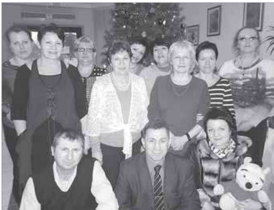
Профсоюзный комитет ООП «НОВАТЭК-Север», 2013 год

Крепкого вам здоровья, успехов в делах для хорошего жизненного настроения. ■