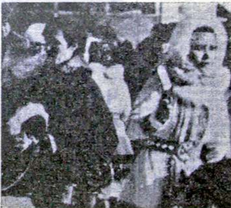
В эти дни в Салехарде проходит международный фестиваль «Дети Арктики».