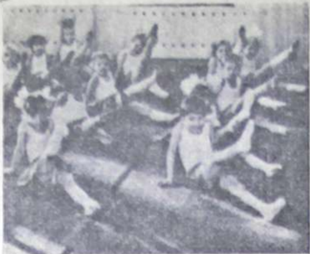
На снимках: занятия физкультурой в старшей группе.