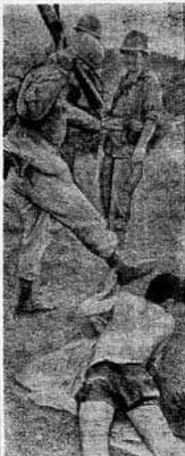
Будучи не в силах победить народ Южного Вьетнама, американские интервенты и их саigonские марионетки усиливают зверства против патриотов, попавших к ним в плен.

НЬЮ-ЙОРК (ТАСС). Рождаемость в Соединенных Штатах заметно упала в 1965 году. По данным управления демографических исследований, в 1965 году в США родилось около 3,8 миллиона человек, т. е. на 227 тысяч меньше, чем в 1964 году. Это значит, что рождаемость в прошлом году была самой низкой с 1951 года.