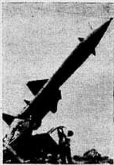
Вьетнамские воины научились бороться с американской авиацией днем и ночью, в любую погоду. Они сбивают хвосты «Ф-105» и сверхзвуковые «фантомы». На снимке: у ракетчиков Вьетнамской народной армии.