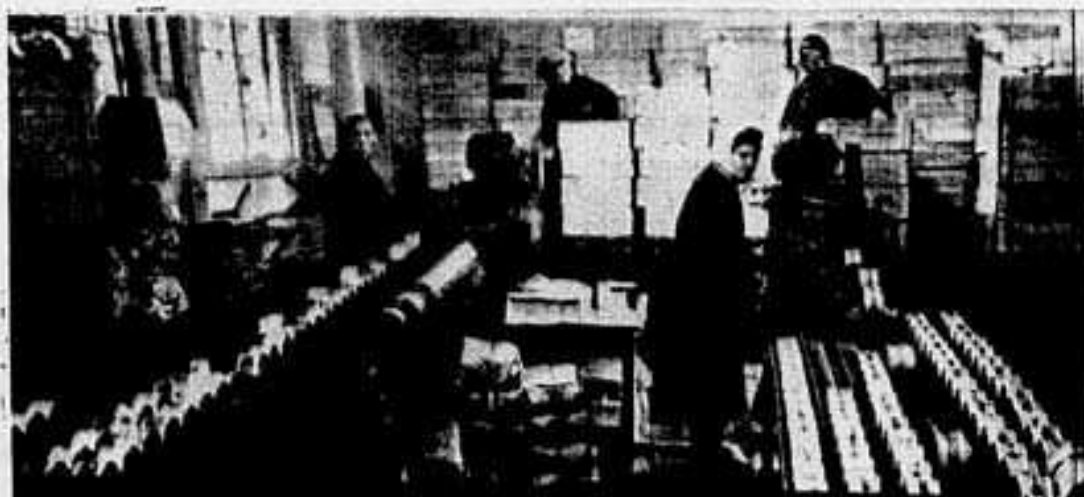
Упаковочное отделение консервного цеха Салехардского рыбокомбината перерабатывает за сутки до 60 тысяч банок консервов, подготавливая их для отправки на базовый холодильники. Досрочно, в 25 июня, закончив выполнение полугодового плана, коллектив упаковочного отделения наращивает темпы, немедленно выполняя задание на 110—115 процентов. На снимке: в упаковочном отделении. Мощным потоком по конвейеру идут деликатесные консервы.