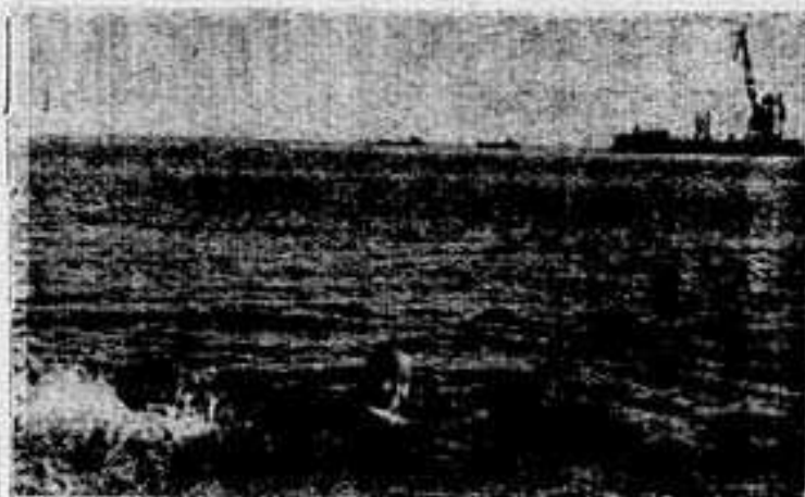
И в Обской губе тоже можно купаться...

О, равнодушны Кушевятского рыбкооп к нуждам нашего поселка свидетельствует и такой факт. Комиссией по здравоохранению и быту, председателем которой я являюсь, не раз проводились проверки пищевых объектов. По нашим актам на сессиях