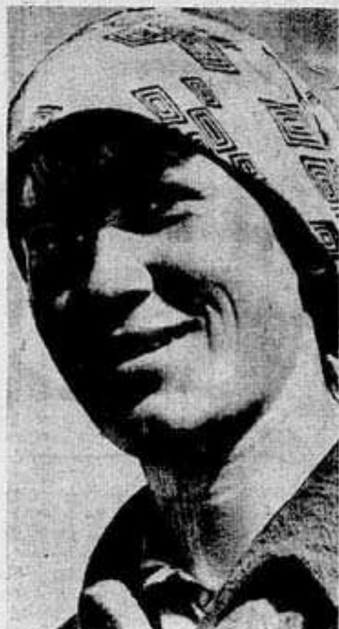
Фото и текст Н. Сычева.

Она довольна своей работой. Она строит, создает. Она дарит людям радость.