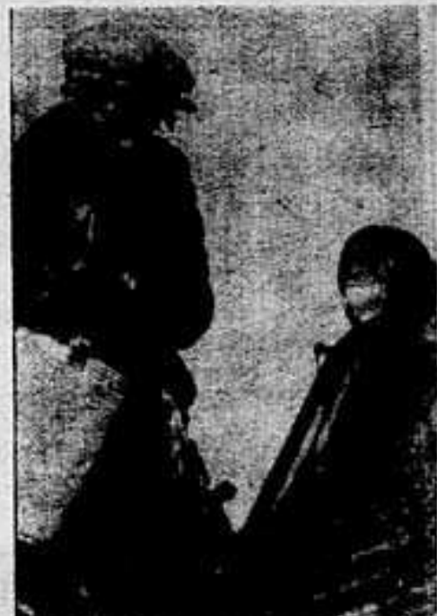
Фото и текст П. Сычева.

Мы рассказали только о немногих деталях трудовых будней новопортковских нефтеразведчиков. Слаженно, огоньком работают здесь люди. Они делают большое дело — открывают для Родины газ.