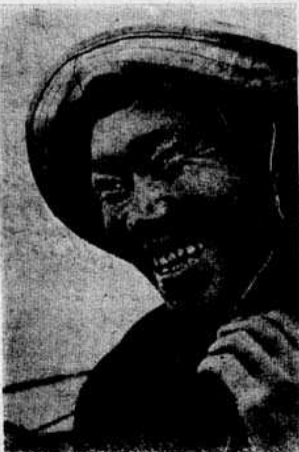
На старте пятилетки