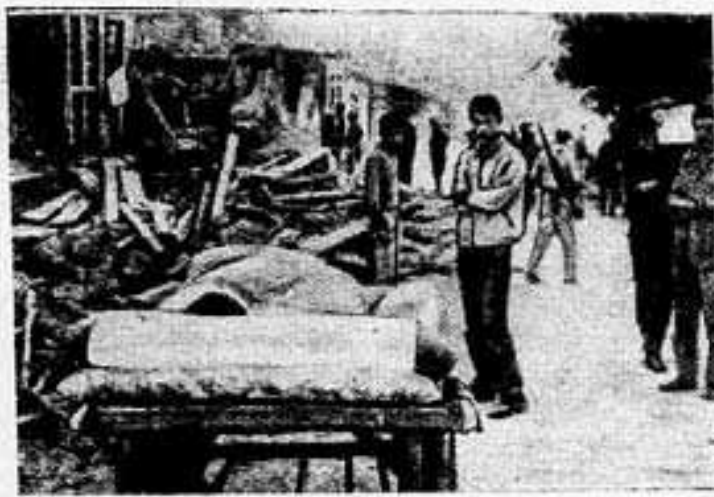
ТУРЦИЯ. В Восточной Анатоллии в районе Эрзурума произошло сильное землетрясение, крупнейшее за последние 23 года.