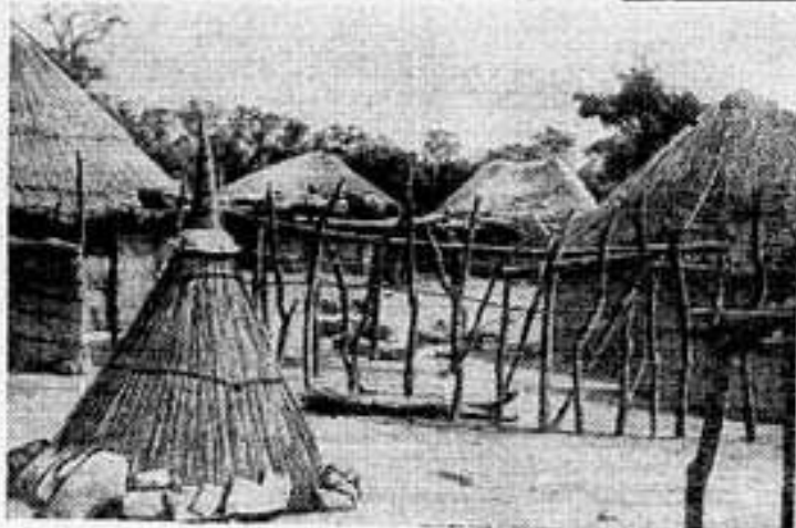
В дневные часы дагомейская деревня безлюдна; взрослые, старики и дети работают на полях. Исторически сложилось так, что поля находились за десятками километров от деревни, и дагомейские крестьяне вынуждены во время полевых работ далеко покидать свои хижины.

На снимке: дагомейская деревня Нгулу в департаменте Северо-Востока. На переднем плане — конусообразный шалаш, в котором хранятся зерновые — кукуруза, сорго. Низ зернохранилища обложен камнями для защиты от местных «брыконыров» — коз и коров.