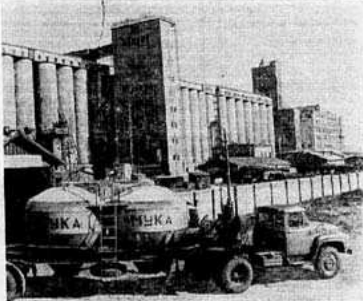
Карагандинский элеватор—один из крупнейших в Казахстане—немедленно принимает зерно от 700 автомашин и 30 железнодорожных вагонов. В то же время из других ворот вывозятся до 1.000 тонн муки и комбинормов. На снимке (справа): очередной рейс муковоза на хлебозавод.