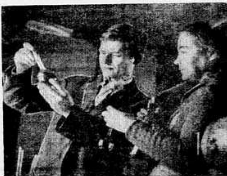
Кислородная станция — самое молодое предприятие в нашем округе. Организовано оно в сентябре прошлого года, и с того же времени станция стала выдавать первые баллоны чистого кислорода для нужд города и округа. Многим предприятиям города требуется кислород.

Потребителями станции являются окружная больница, Салехардская экспедиция, консервный комбинат, лесобазы, СУ.