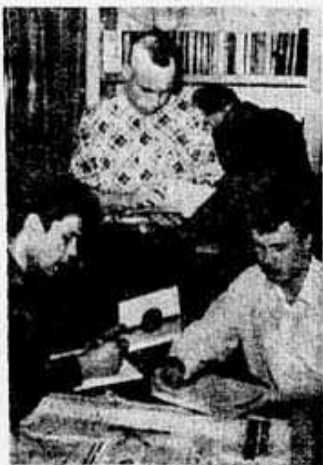
С борта теплохода «Салехард»

Экипаж шефствует над 7-А классом 21 школы Архангельска и 4-Б классом 8 школы г. Салехарда. А комсомольская организация судна ведет дружескую переписку с комсомольской организацией лицейского г. Салехарда. Сейчас, прибыв в порт Ленинград,