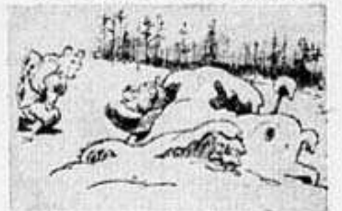
— Не вставай, иди сюда: до весны нажато не тронет.