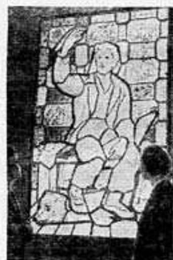
Москва. В Центральном выставочном зале открылась художественная выставка «25 лет Советской Литвы, Латвии и Эстонии». Здесь экспонируются произведения живописи, скульптуры, графики и декоративно-прикладного искусства. Выставка продлится более месяца.

В. Надочников, наружда Приуральского района.