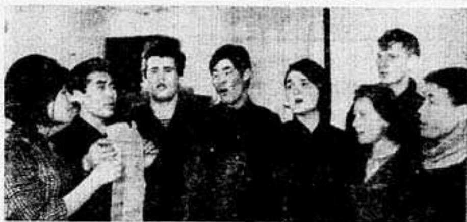
В конце марта в селе Мужей будет проходить районный смотр художественной самодеятельности. В нем обязательно примут участие и воспитанники.