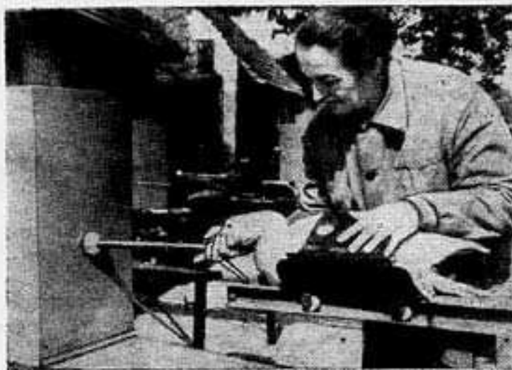
Специалисты сельскохозяйственного института в Геддле (Венгрия) сконструировали приспособление для интенсивного массового отбора гусей. В Табашке начал серийный выпуск этих аппаратов. При нормальном новом методом гусей быстро набирают в весе, пень их бывает больше и вкуснее обычного.

нистов в специально созданные концентрационные лагеря. В нашей законодательной системе существуют и другие положения, направленные против Коммунистической партии. В этой связи уместно напомнить о самом первом законе, проташенном ультра и существующем и поныне, — законе Смита. На его основании более 130 лучших американских коммунистов в результате шумных судебных процессов конца 40-х и начала 50-х годов были заключены в тюрьмы. Причем приговоры основывались на некоей фантастической идее. Обвиняемым инкриминировалась «тайная пропаганда призывов когда-нибудь сместить правительство». Каждому понятно, сколь нелепа эта грубая фальшивка. День за днем ФБР — американская политическая полиция — продолжает преследования коммунистов, борцов за мир. Но прогрессивное движение Америки становится все сильнее. На его стороне — растущие силы мира во всех странах земного шара. Арт ШИЛДС, американский публицист, (АФН)