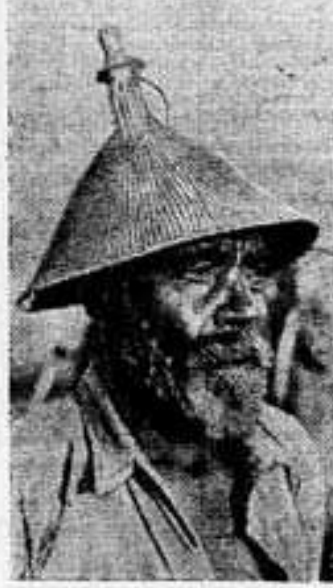
За последние пять лет были ликвидированы рынками колониального и подопечного управления на территориях с населением 57 миллионов человек. Под коммунистическим гнетом все еще остается свыше 85 территорий с населением около 50 миллионов человек. В 1966 году будет провозглашена независимость Басутоленда — английского протектората в Южной Африке. На снимке: старинный народности басуто и национальным годовым уборе, сплетенном из травы.