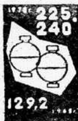
ГАЗ (млрд. куб. м)