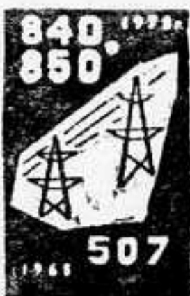
ЭЛ. ЭНЕРГИЯ (млрд. квт-час)

Поставить колхозам и совхозам в 1967—1970 годах 1790 тысяч тракторов (в том числе 780 тысяч колесных), 1100 тысяч грузовых автомобилей, 900 тысяч тракторных и 275 тысяч автомобильных прицепов, 550 тысяч зерноуборочных комбайнов.