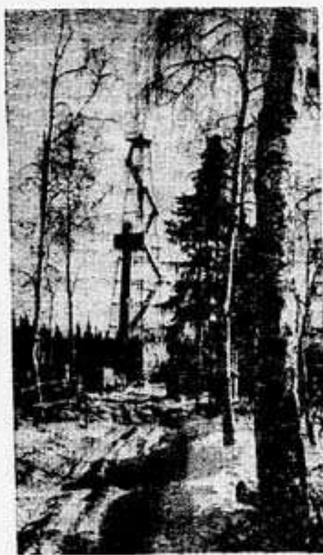
Пуровские контрасты.