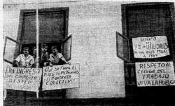
В Эквадоре не прекращается классовая борьба. Рабочие предъявляют требования об улучшении условий труда, защищают свои профсоюзы.

Изданию в крупнейшем городе страны Гуаякиле объявила забастовку коллектив швейной фабрики «Хабонериа националь». Рабочие зашли в цех предприятия.