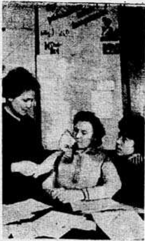
Социалистическая культура прочно вошла в быт коренного населения нашего округа — немцев и хантов.

Этому немало способствуют пропагандисты культуры в тундре — бывшие воспитанники Салехардского культурно-просветительского училища. Работал в самых отдаленных уголках нашего округа, они не прерывают связь с училищем.