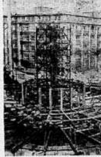
В центре Берлина рядом с площадью Александерплац ведется строительство телевизионной вышки. Готовое сооружение будет иметь смотровую площадку. С высоты 200 метров перед жителями и гостями откроется панорама столицы ГДР. Из середины фундамента уже растут стальные конструкции будущих лифтов.

СОФИЯ, (ТАСС). В 1956 — 1965 гг. население Болгарии увеличилось почти на 613 тыс. человек и превысило 8.226 тысяч человек, сообщает агентство БТА.