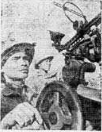
ДЕМОКРАТИЧЕСКАЯ РЕСПУБЛИКА ВЬЕТНАМ. Вместе с воинами Вьетнамской Народной армии с оружием в руках защищают родину бойцы народной милиции и отрядов самообороны. На снимке: бойцы отряда самообороны суперфосфатного завода Лам Тхон в провинции Фуч-хо на военной учебе.

В дружественном Афганистане при техническом содействии СССР завершено сооружение автомобильной магистрали Кушна — Герат-Кандагар, протяженностью около 700 километров. На новой автострате возведены десятки железобетонных мостов, построены бензоэлектрические станции технического обслуживания автомобилей, комфортабельные гостиницы. Новая дорога сыграет большую роль в