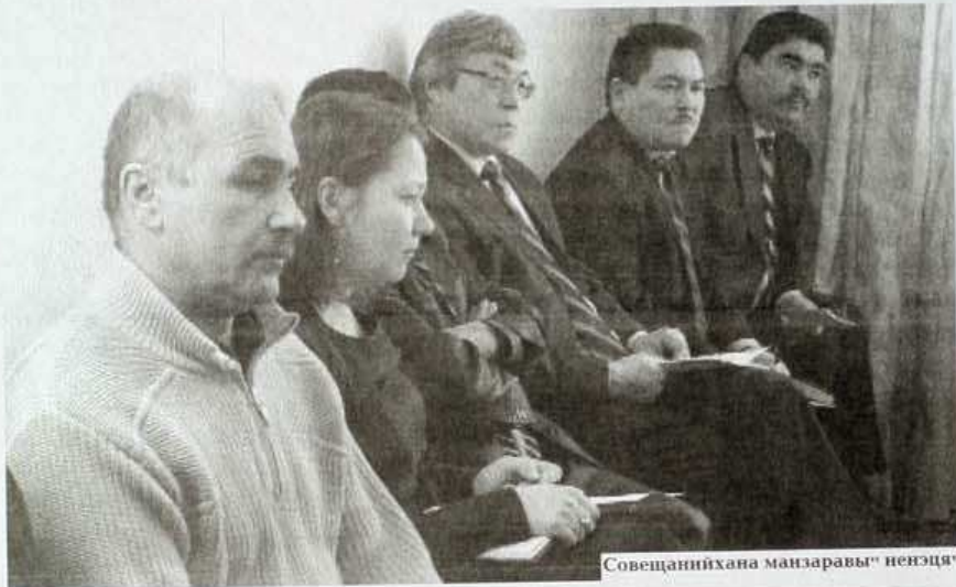
Совещанийхана манзаравы" ненэця"

Нэрка яханана" ненэце" поёмби". Маньрина" ругханана" серона" сававна миңа". Догово" мал" падвы", 20 по" ямб" ненэць" нянда падвы я" нанда халям" хадаба" Хэвняңы" ненэцяңд" я" мипбата ни серос".