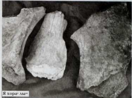
Я хора" лы"

дава" иле ханава". Аксарка хардахана машиню" пэява". Таддикахад мякна" иэдальма". Тад им' иэдараб", маня" иэдальмэ"э нярка манзаям' сертаваць. Хотяко Мэйкович Езынг' махада нэ"г таявы.