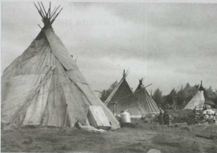
Х.Х.Ясавэй' фотозтюд: «Яха лаңг' ниня няхар ю' мя»

Нявхы похона" вэсако илевы. Хасава нюда таниявы. Нюда ёльце мэбе"мы. Хаяхаяда" яхана" сита пирм' нивы хомбю". Нянанда переня" ноб" яңговы. Тароць пэбнанда цопой нударихина нида" ян" ха"аврамбавыда. Ханияримна тароць нядамда пювы. Хось ноб" я"амвы. Тарем' лаханавы: