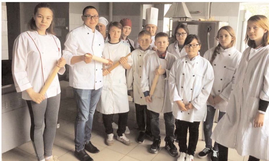
В экспедиции школьники приняли участие в кулинарном мастер-классе

Продолжение. Начало читайте в №26 "Северной панорамы".