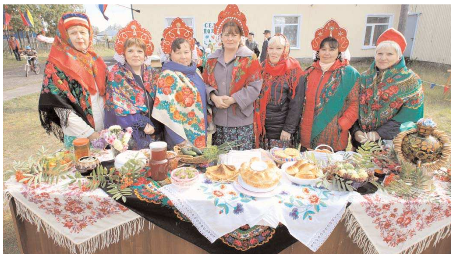
Коллектив детсада "Северяночка" - победители кулинарного конкурса "Аллея дружбы"