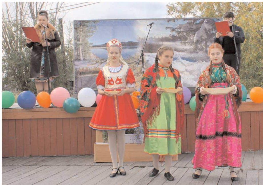
В Восяхово гостей праздника встречали хлебом-солью