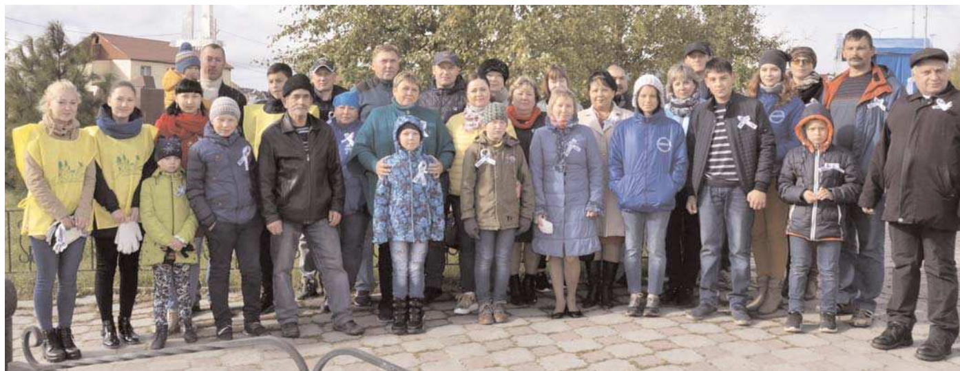
В День села мужевцы приняли участие в региональной акции "Живая Арктика"

В минувшее воскресенье по всему району прошли праздничные мероприятия в рамках Дня села