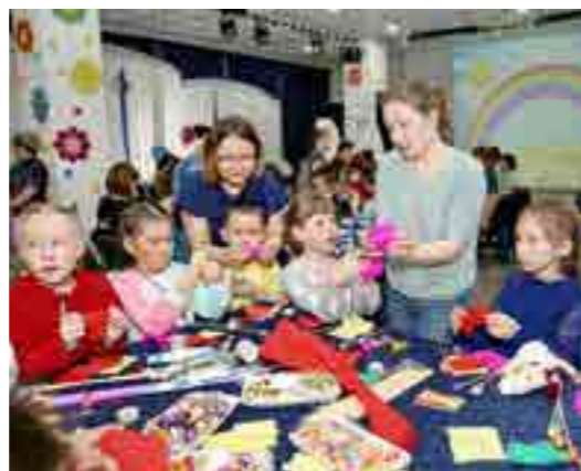
Мастер-класс по изготовлению сладкого букета: и красиво, и вкусно!