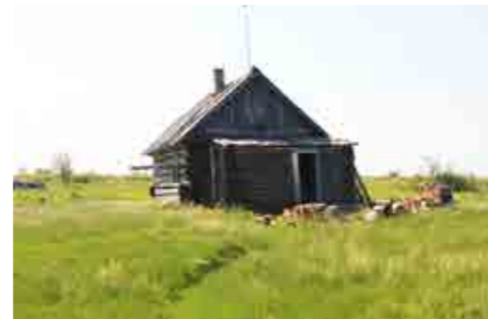
В дар музею местная жительница передала свой дом, построенный в прошлом веке, с настоящей печкой