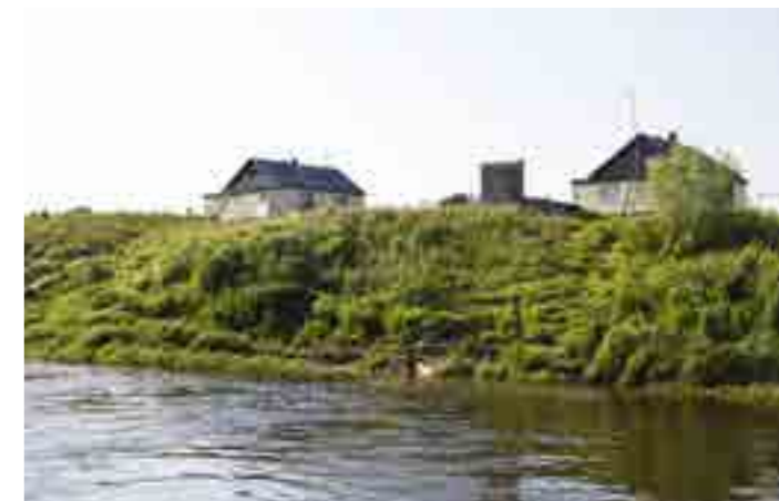
В Тибей-Сале в полной мере можно ощутить спокойствие, неторопливость жизни и единение с северной природой

быта, соответствующих 60-70-м годам. Правда, для полноценного функционирования объекта необходима уборка и замена крыши - этим работники займутся в ближайшее время.