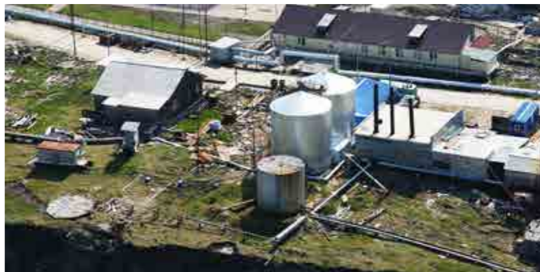
Гыданцы уже почти месяц используют в быту очищенную воду, правда, пока новые очистные работают в тестовом режиме. Ввод объекта намечен на сентябрь