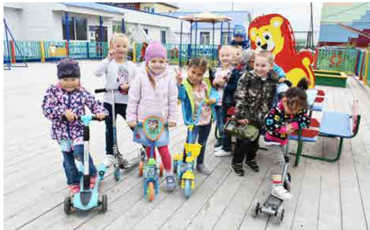
Ребята, посещающие детский сад «Теремок», на прогулке перед дневным сном

► БОЛЬШЕ ФОТОГРАФИЙ К ЭТОЙ ТЕМЕ НА НАШЕМ САЙТЕ WWW.SOVETSKOYE.ZAPOLYARIE.RF