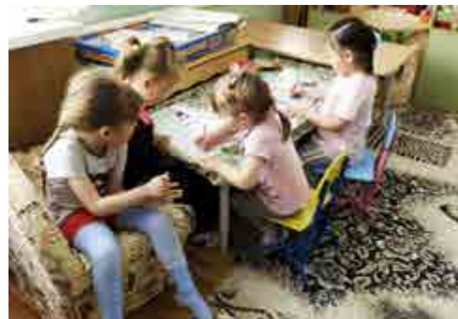
Юные воспитанницы детского сада «Солнышко» рисуют очередные шедевры для своих мам

Дежурные сады. Каждое лето детские сады районного центра закрываются для проведения ремонтных работ и подготовки к новому учебному году. Но всегда остаются одна-две образовательные организации, которые принимают детей, остающихся летом в посёлке