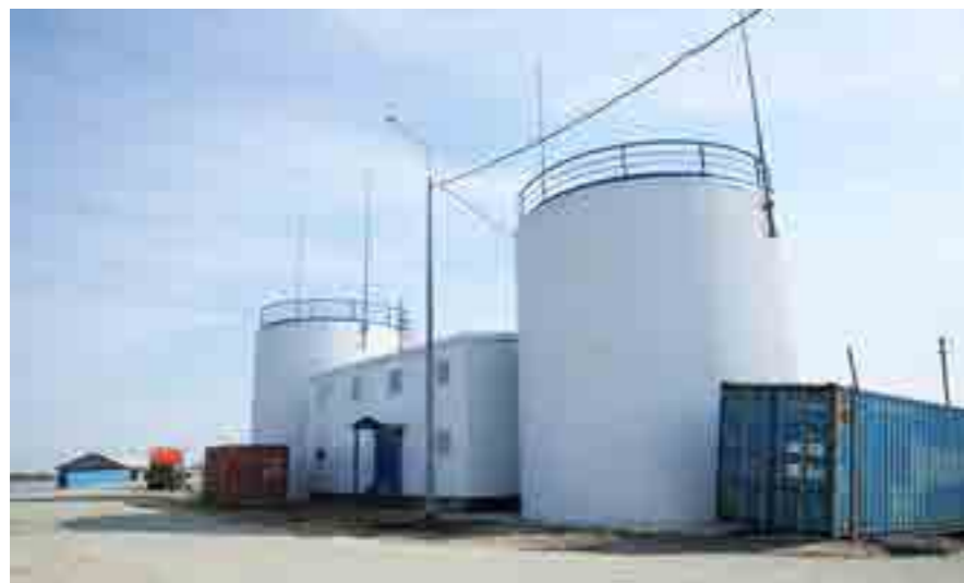
Строительство очистных сооружений для нужд антипаютинцев производилось мощностью 500 кубов воды в сутки началось в 2017 году. Сейчас объект находится в высокой степени готовности