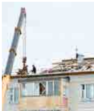
Капремонт кровли Геофизиков, 30, подрядчик должен завершить к 15 сентября