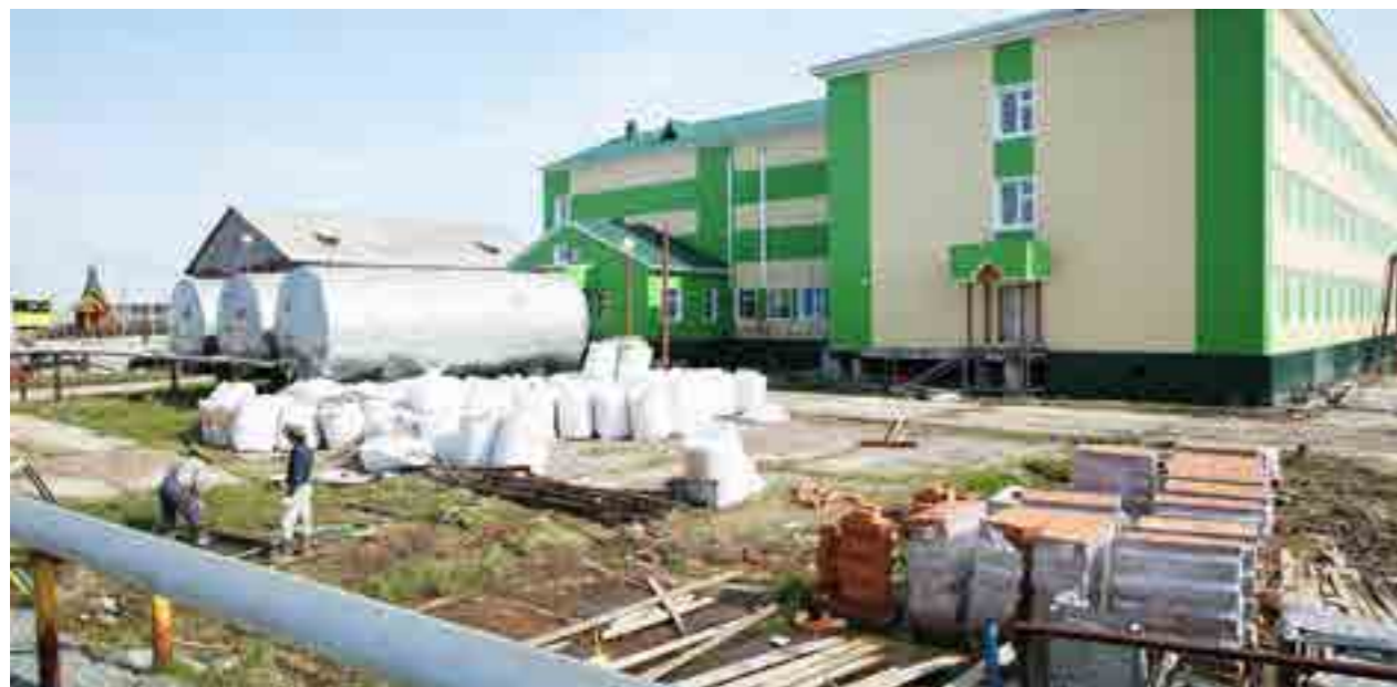
Учебный корпус Антипаютинской школы-интерната после реконструкции в этом году примет учащихся