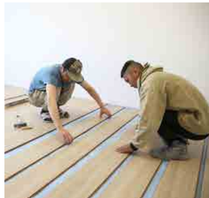
Детям будет комфортно в капитально отремонтированном спальном корпусе Гыданской школы-интерната

В 2019 году нам из окружного бюджета на текущий