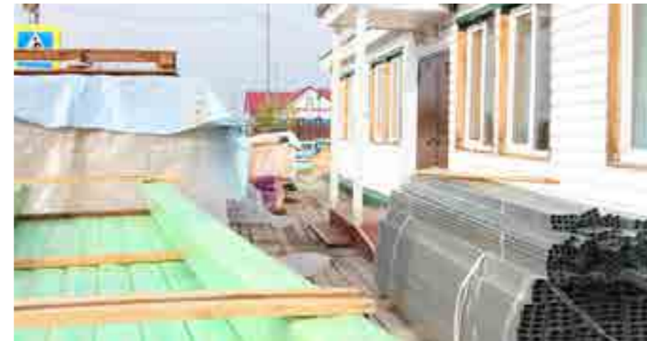
Ремонтные работы во втором корпусе строители планируют закончить к сентябрю

Напомним, что в это лето «Белый медвежонок» остался дежурить - сейчас сюда ходят порядка 25 детей. В первом корпусе, куда ежедневно приходят малыши, был проведён косметический ремонт силами сотрудников: местами заменили обои, покрасили плинтусы, на улице возле входа посадили цветы, побелили деревья, соорудили место для хранения колясок и велосипедов. Внутренние работы проводили вечерами и в выходные, чтобы не мешать дошколятам.