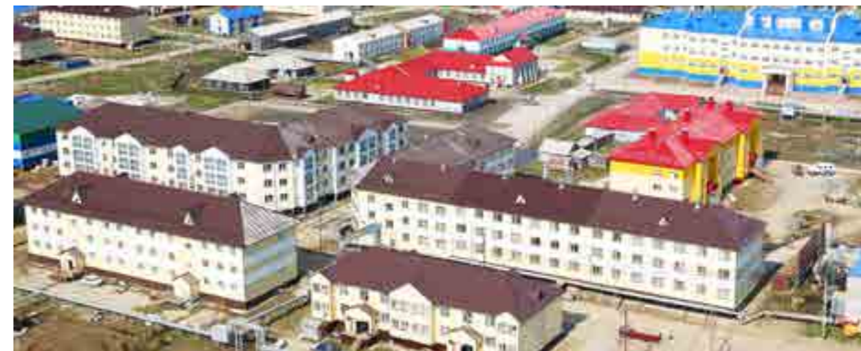
Гыда первой из всех поселений района выполнит Указ Президента РФ по переселению из ветхого и аварийного жилья