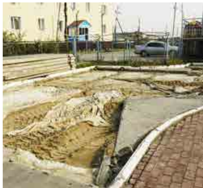
Подрядная организация уже приступила к перекладке дорожных плит во дворе детского сада

Ремонт. На календаре начало августа, а это значит, что остаётся всего один месяц до нового учебного года, когда образовательные организации района распахнут свои двери для юных тазовчан. Поэтому во многих организациях идут косметические и капитальные ремонты. В детском саду «Радуга» в райцентре говорят, что не относят себя к числу ремонтируемых, но красоту и порядок непременно наводят