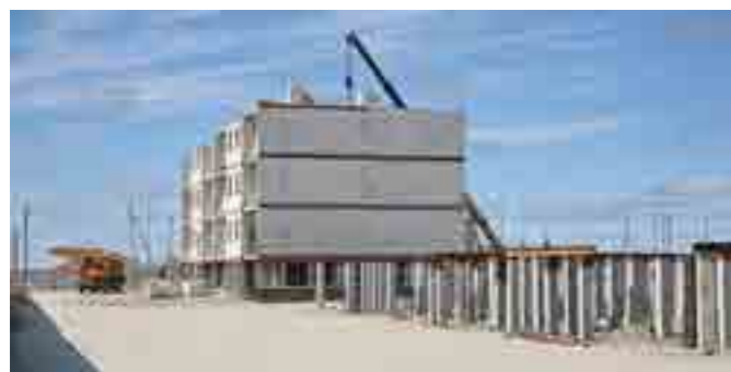
В 2021 году в двух домах первой очереди микрорайона Солнечный справят новоселье 274 семьи