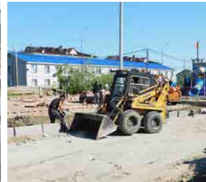
Просторная зона отдыха в районе дома Геофизиков, 18, в районном центре - один из самых крупных объектов благоустройства в этом году

ле должны быть построены все перегрузочные станции и новые полигоны ТБО.