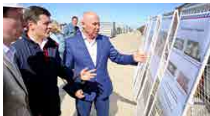
Глава района Василий Паршаков показывает будущие строительные объекты губернатору Дмитрию Артюхову