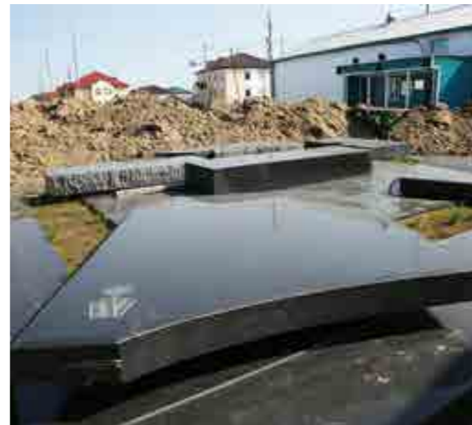
На площади перед сельским Домом культуры в Гыде в рамках программы «Комфортная городская среда» появится зона отдыха и памятник воинам Великой Отечественной войны

Сейчас за обращение с ТКО отвечает Региональный оператор - общество «Инновационные технологии». Но пока ответственность за содержание свалок ТБО лежит на органах местного самоуправления. Все свалки будут включены в Государственный реестр объектов размещения отходов ЯНАО, который узаконивает размещение ТКО в переходный период до 2023 года. К этому времени на Яма-