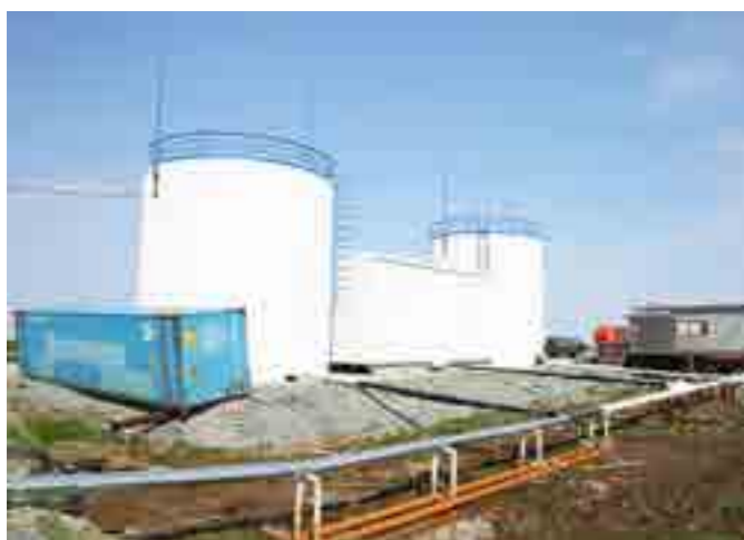
ВОС-500 в Антипаюте должны ввести в эксплуатацию в октябре 2019 года