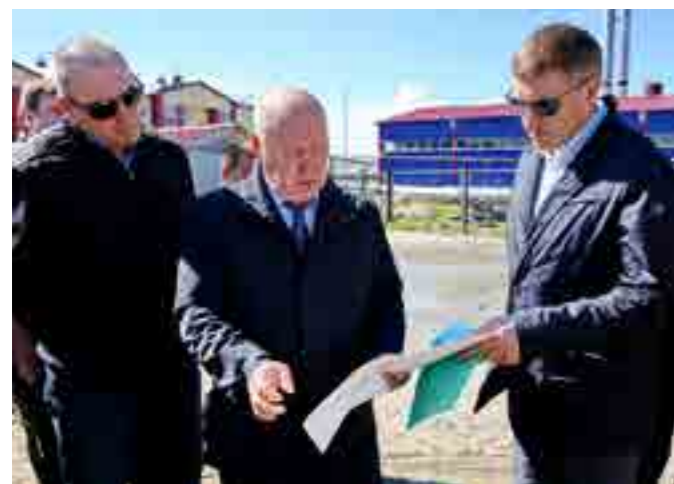
Благоустройство и ремонт дорог - на постоянном контроле и Главы района, и Губернатора Ямала