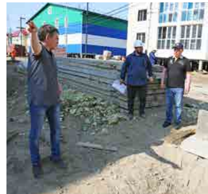
Возле строящихся домов по улице Советская в Гыде в рамках благоустройства создадут зону отдыха

ремонт дорог выделено в 2 раза больше средств, чем в 2018 году - 257 млн рублей. Конечно, мы могли бы использовать эти средства именно на текущий ремонт. Но в целях более рационального использования бюджетных средств мы часть средств направили на капитальный ремонт участков дорог и на проектирование ремонтных работ, чтобы к следующему году у нас на руках были готовые проекты.