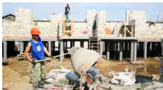
23-квартирный жилой дом в Антипаюте (застройщик - ООО «Тазстройэнерго») строители намерены сдать раньше намеченного срока