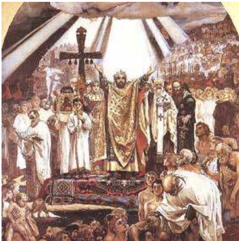
«Крещение Руси». Фреска работы В.М. Васнецова в киевском Владимирском соборе. 1896 год

Крестился князь Владимир в Корсуни (Херсонесе) в 988 году. Это событие разделило его жизнь на две половины, разительно отличающиеся друг от друга.