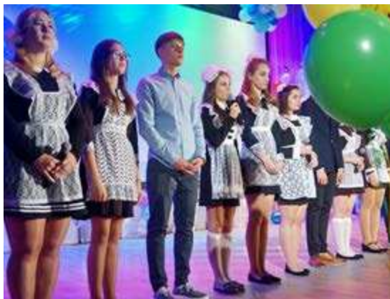
Для 42 ребят прошедшее 1 сентября стало последним в стенах родной школы