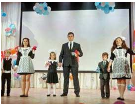
Первый звонок прозвучал для 157 ребят