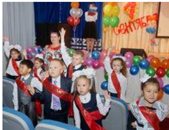
Впервые встречаются День знаний 7 первых классов от литеры «А» до «К»