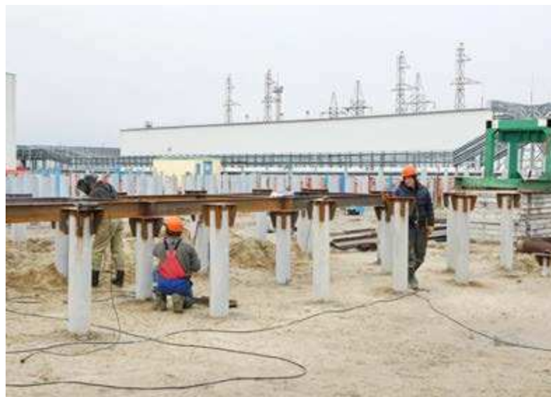
Первые сваи на будущей ГТЭС Заполярного месторождения уже забурены

На новой электростанции будет установлено четыре турбоагрегата отечественного производства мощностью по 12 МВт каждый. Сдача самой мощной ГТЭС на Заполярном месторождении запланирована на 4 квартал 2018 года.