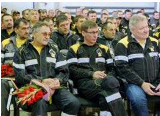
В зрительном зале собрались десятки работников промысла