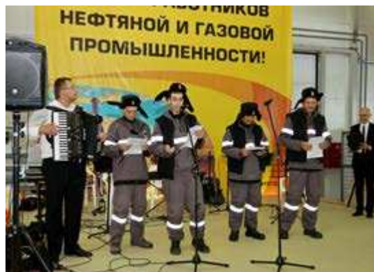
Частушки собственного сочинения в подарок коллегам