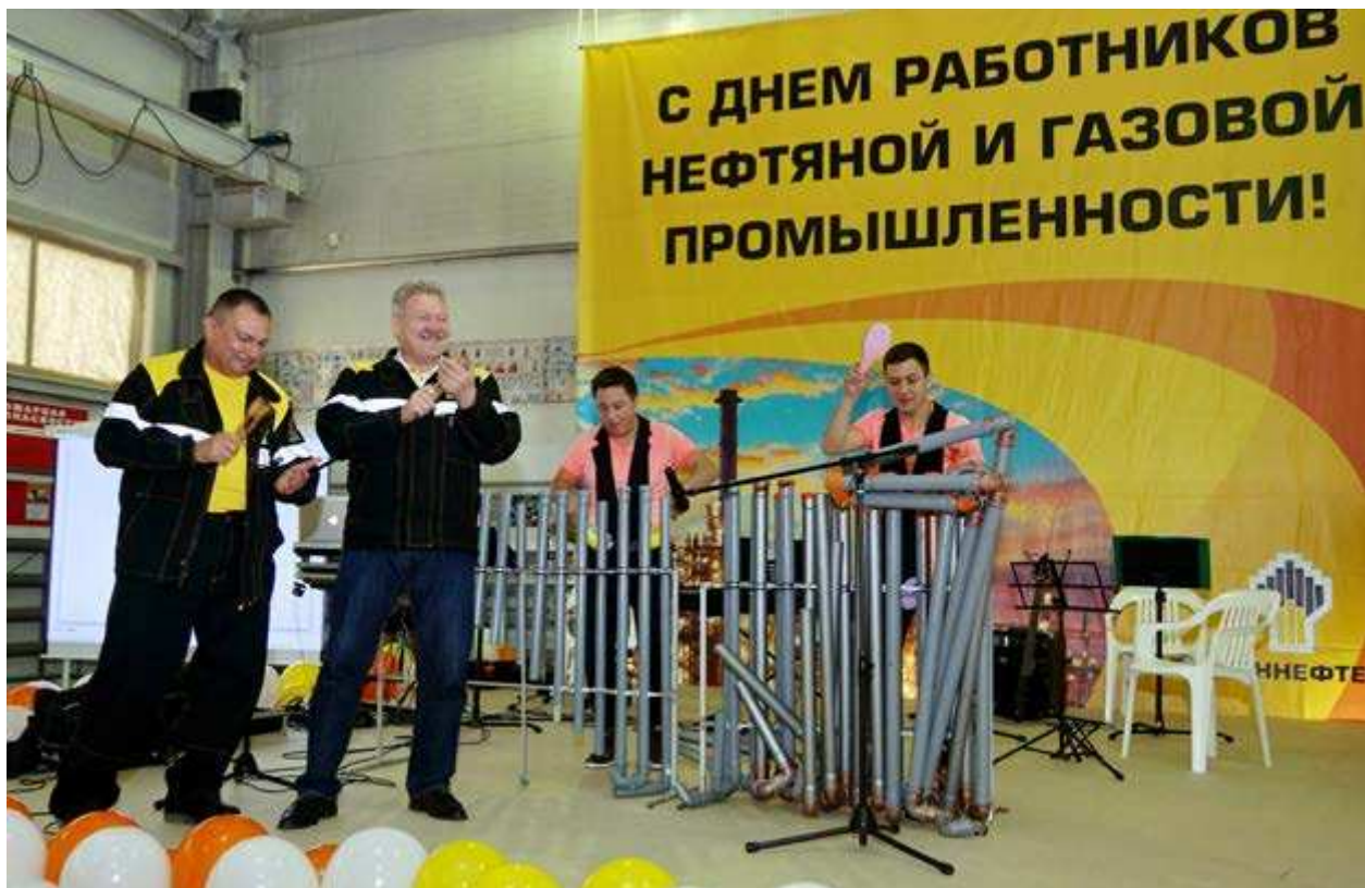
Нефтяников Русского месторождения с профессиональным праздником поздравили артисты из Нового Уренгоя и Екатеринбурга