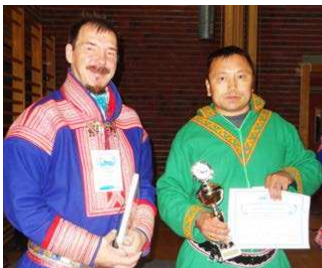
Самый меткий оленевод - чемпион мира по метанию аркана - наш земляк