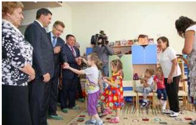
Всем гостям малыши подарили сувениры, сделанные вместе с воспитателями