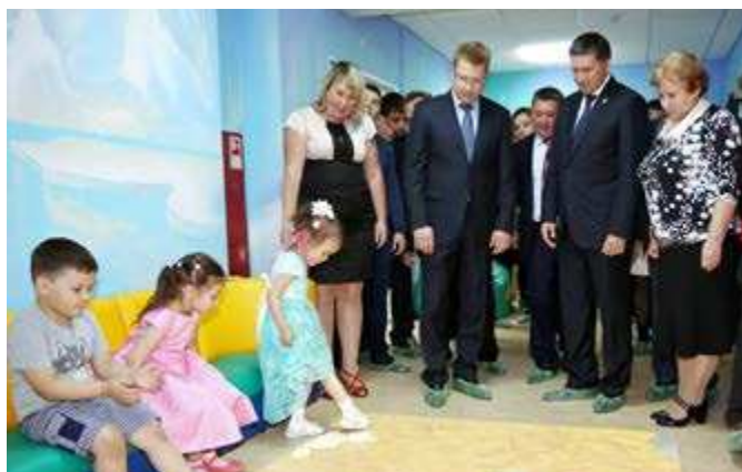
Интерактивный пол в детском саду используется как для развлечения, так и в образовательных целях

В конце торжественного открытия воспитанники нового «Оленёнка» отпустили в небо воздушные шары, в которые вложены записки с пожеланиями детей и сотрудников дошкольного учреждения, чтобы все мечты обязательно сбылись!