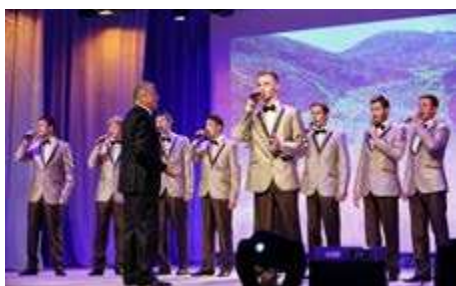
Мужской хор из Екатеринбурга исполнил песни о геологии