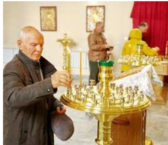
Во время экскурсии по районному центру гости праздника посетили православный храм