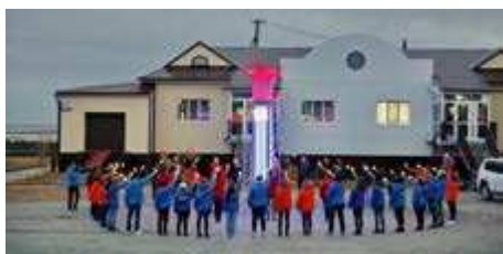
Световой флешмоб «55» силами тазовских школьников