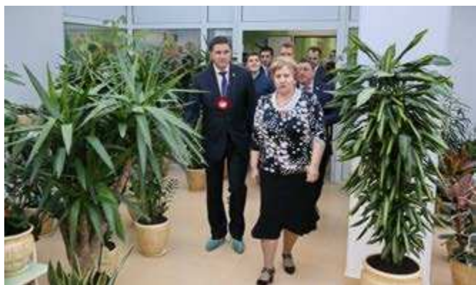
Новый «Оленёнок» - пока единственное дошкольное учреждение в районе с шикарным зимним садом