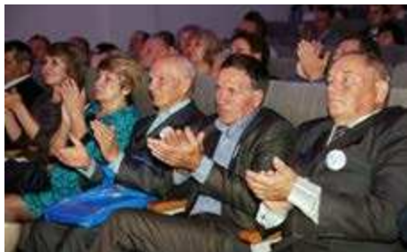
Их молодость - это геофизика, геология и нефтегазодобыча