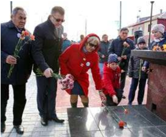
В честь юбилея Первого газового фонтана гости праздника возлагают цветы к памятнику геологам-первооткрывателям