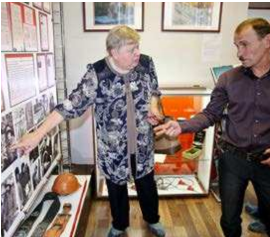
На чёрно-белых фотографиях в музее - геологи и нефтегазодобытчики эпохи начала освоения Заполярья