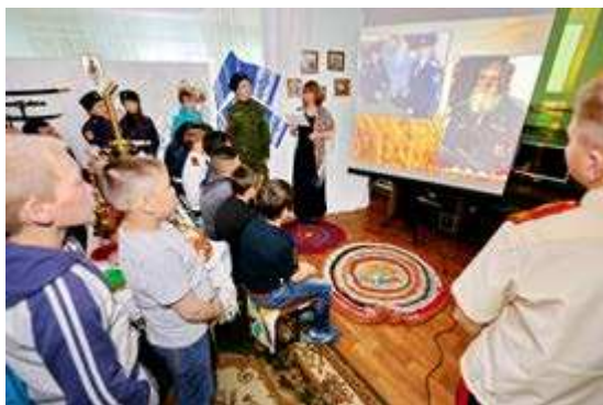
Кадеты знакомят с казачьими традициями и обычаями