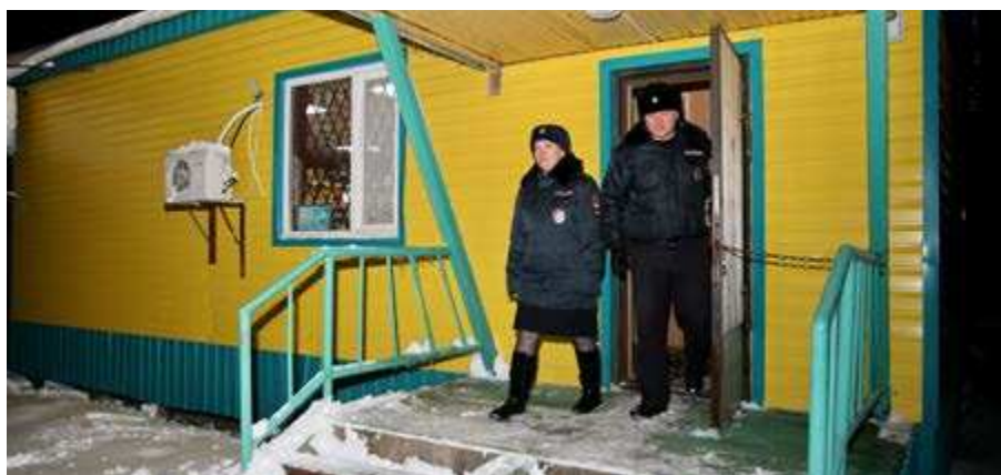
Рейды для выявления фактов продажи алкоголя в неположенное время или несовершеннолетним проводятся практически еженедельно

Казалось бы, штрафы должны пугать, но из года в год полицейская статистика показывает, число желающих приобрести алкоголь в запрещённое время не уменьшается. Например, в этом году выявлено 9 подобных фактов, случаев продажи спиртного несовершеннолетним пока не зарегистрировано.