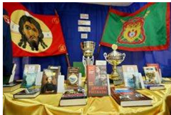
Множество произведений в литературе посвящены казакам