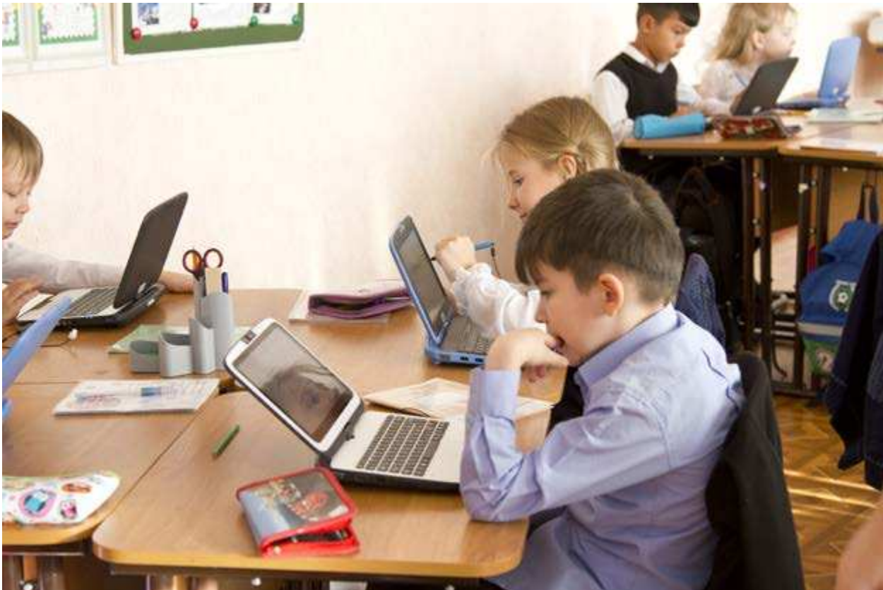
Учащиеся 2А класса Газ-Салинской школы второй год занимаются по электронным учебникам