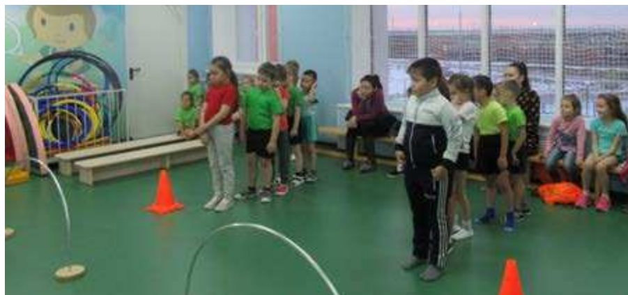
Встреча с первоклассниками - выпускниками детского сада «Оленёнок»