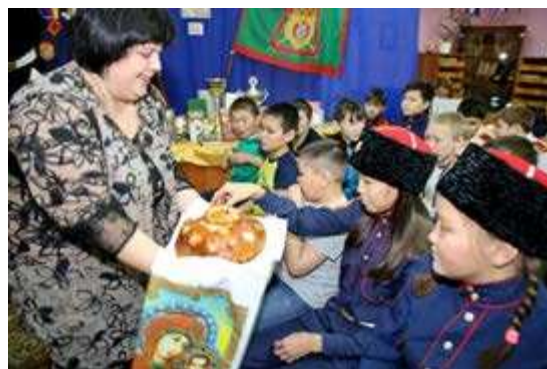
Каравай - как символ казачьего гостеприимства