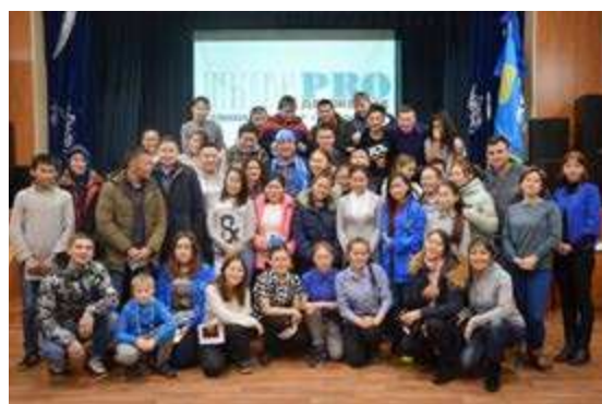
Отрадно, что участниками семинара-тренинга «ГЫДА: ПРОдвижение» стала не только молодёжь

района, округа и России. Я открыла для себя новые способы взаимодействия с молодёжью. В принципе, если сравнить «до» и «после», неделя этой работы показала, и это можно увидеть даже по тому же школьному самоуправлению, что были сделаны семимильные шаги. У нашей молодёжи сейчас появился блеск в глазах, точнее он усилился, они поверили в то, что всё это можно реализовать. Поэтому я бы пожелала не растерять этот задор, этот интерес. А нам всем надо поддержать наших детей. Ведь если мы будем их прочной опорой, то все замечательные идеи можно воплотить в реальность!