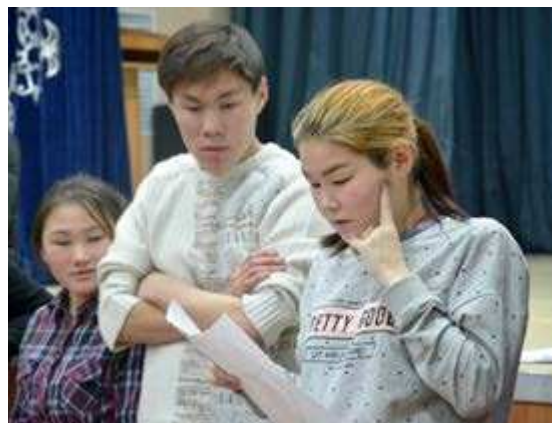
Все замечательные идеи можно воплотить в реальность

П Что такое созидание? Для чего оно нужно? Как узнать о своей миссии в этой жизни? Вроде бы, риторические вопросы... Но молодые гыданцы смогли найти ответы на них