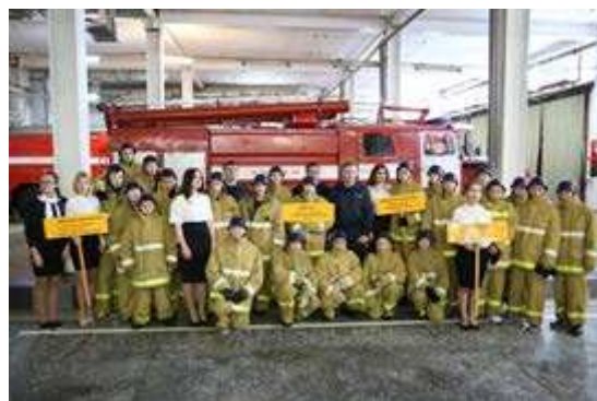
Кто-то из этих мальчишек в будущем, возможно, станет пожарным