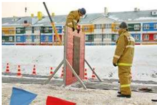
Забор - одно из препятствий первого этапа соревнований