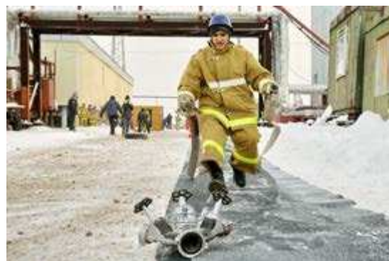
Планируется, что в следующем году в слёте юных пожарных примут участие и школьники из других районов ЯНАО