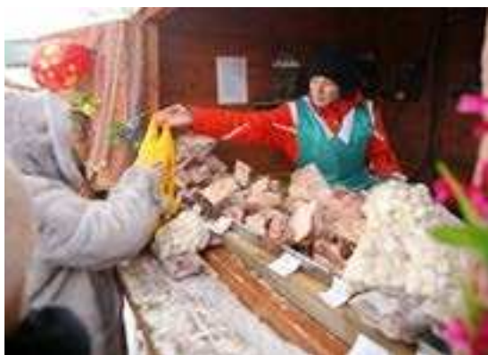
СПК «Тазовский» торговал не только рыбой, но и мясом оленя