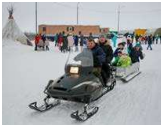
Прокатиться на снегоходе хотел практически каждый