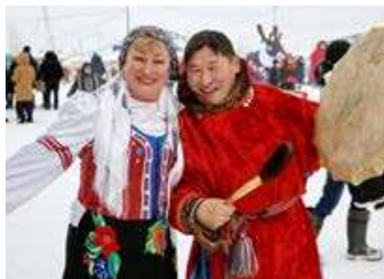
Гостей ярмарки развлекали тазовские артисты