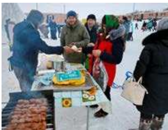
Горячие шашлыки и чай - для желающих немного отдохнуть