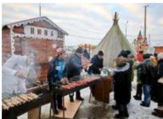
Традиционное лакомство любых народных гуляний - шашлыки