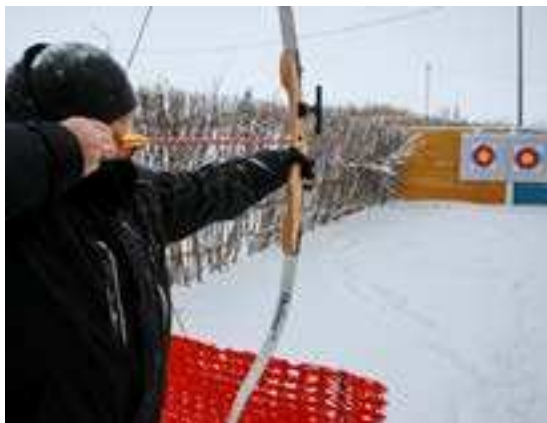
Стрельба из лука - занятие для самых метких