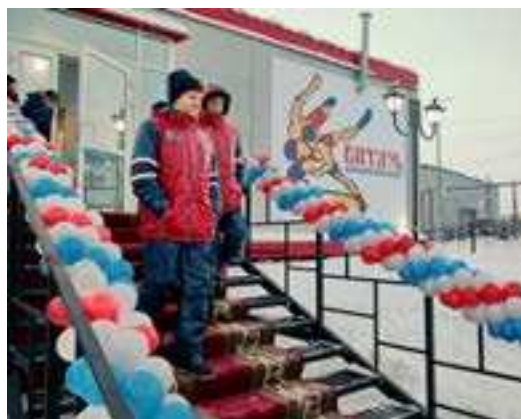
Возможно, в будущем «Витязь» примет соревнования на Кубок Главы района