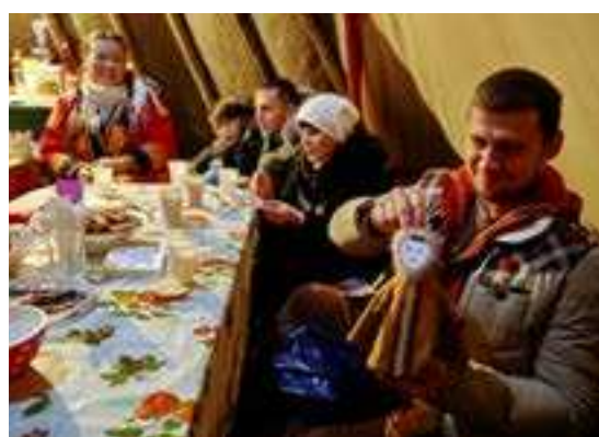
В гостеприимном чуме можно было не только отведать ухи, но и загадать желание

чтобы хоть как-то скрасить разочарование от отсутствия щёкура. Причём по очень демократичным ценам. Дороже всего стоили ряпушка и сырок в зависимости от вида копчения - по 230-245 рублей. А, например, мороженых налима или язя можно было купить по 36-45 рублей за килограмм. Поэтому многие уходили с площади, полностью загруженные деликатесами.