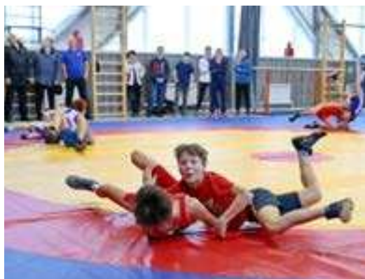
Юные спортсмены отрабатывают борцовские приёмы