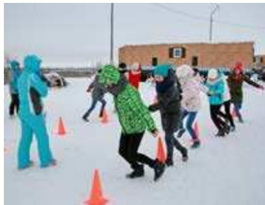
Разнообразные эстафеты на быстроту, выносливость и меткость привлекли ребятню