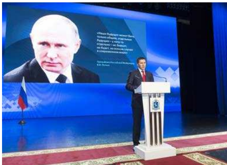
Глава региона Дмитрий Кобылкин выступил с ежегодным Посланием

Третий год подряд на Ямале наблюдается промышленный подъём. За 9 месяцев этого года он составил 13% - это существенно выше среднероссийского. 50% промышленной продукции арктических регионов России создано в округе. Каждый второй рубль валовой добавленной стоимости, полученной предприятиями Арктической зоны России, произведён на Ямале. «Более половины жилья, введённого в арктической зоне, при-