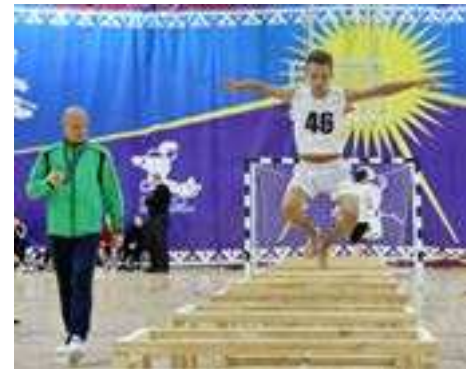
прыгали через нарты