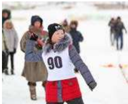
метали топор на дальность