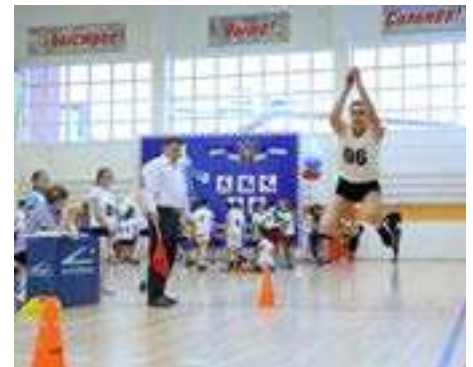
выполняли тройные прыжки