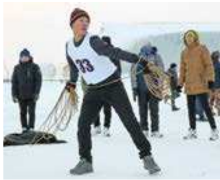
ловко кидали тынзян на хорей

📷 БОЛЬШЕ ФОТОГРАФИЙ К ЭТОЙ ТЕМЕ НА НАШЕМ САЙТЕ WWW.SOVETSKOESKOZPOLYARJE.RF